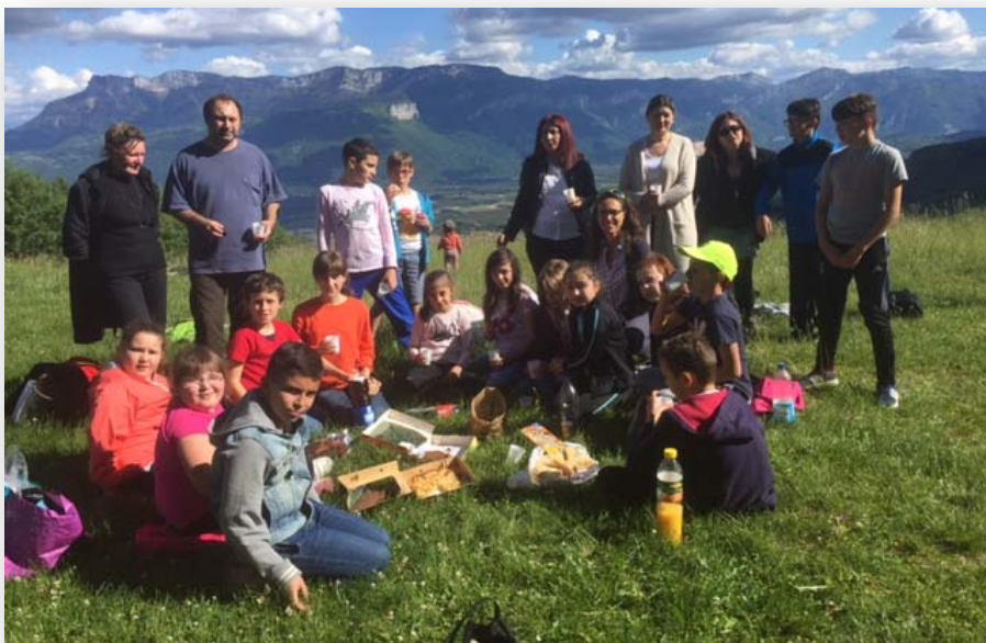
PAROISSE SAINTE CROIX