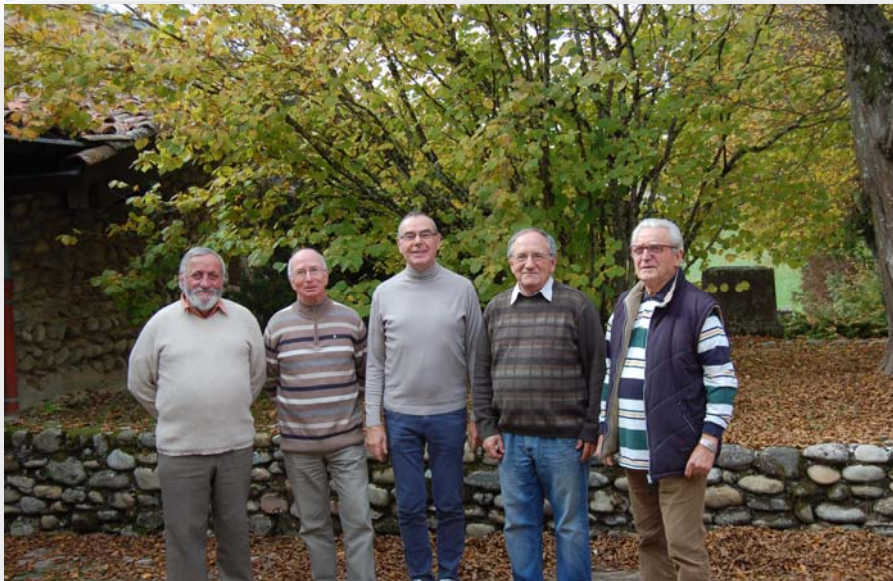
Communauté des frères de PARMÉNIE