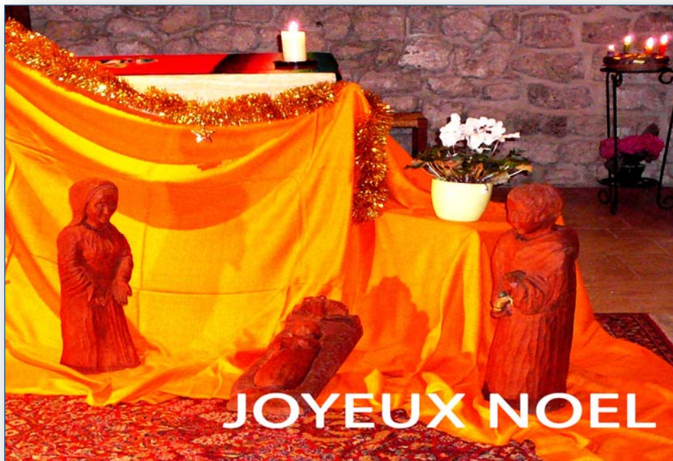
Crèche de Noël - Chapelle Romane